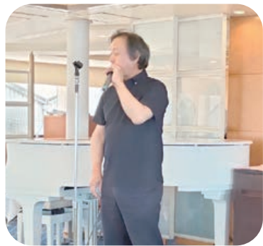
あいさつする赤塚分会長