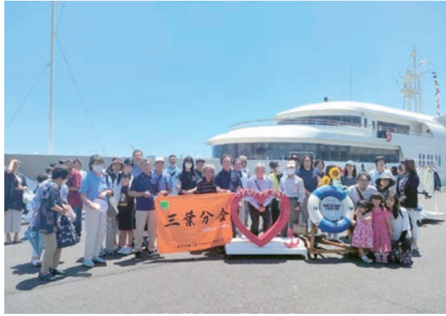
参加者全員で集合写真